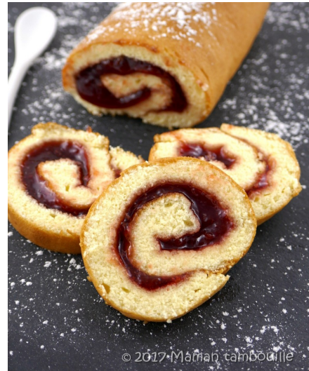
Cette photo par Auteur inconnu est